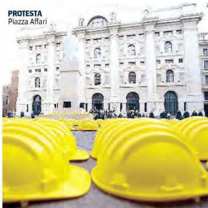
PROTESTA Piazza Affari

IMPEGNO Solidarietà bipartisan dalla politica: «Serve meno burocrazia»